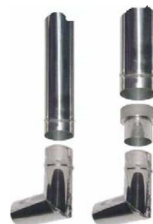
Inntil ca. 5.3 kW